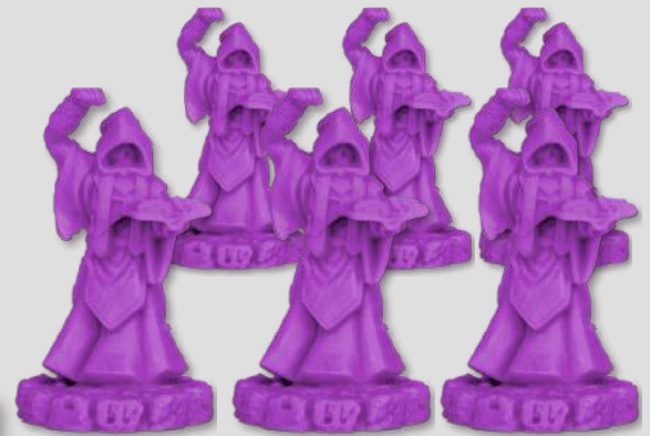
6 KULTISTEN (AKOLYTHEN)