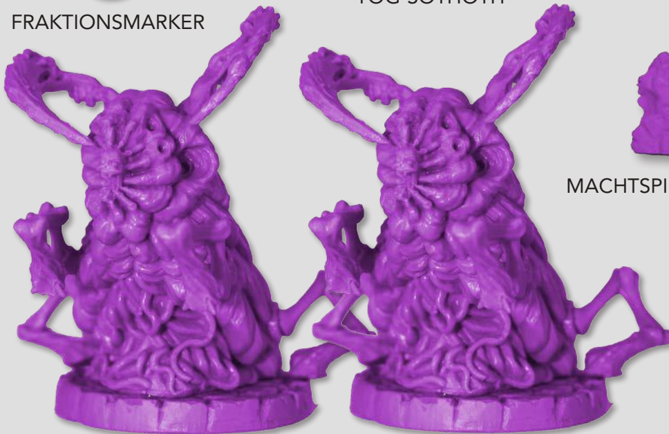
2 BRUTEN VON YOG-SOTHOTH