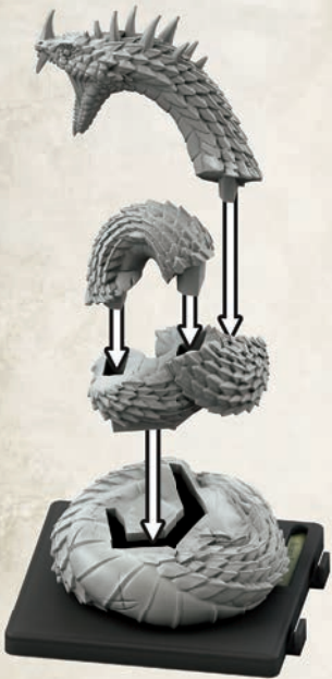
Uralter Basilisk beim Zusammenbau

Der Uralte Basilisk wird in vier Teilen geliefert, die (wie in der Abbildung gezeigt) zusammengeklebt werden müssen. Erst wenn der Klebstoff trocken ist, sollte der Uralte Basilisk auf seiner Basis befestigt werden.