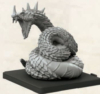
Uralter Basilisk nach dem Zusammenbau

Der Uralte Basilisk muss auf einer großen Basis und die Tempelwächter müssen auf mittelgroßen Basen festgeklebt werden. Dafür empfehlen wir Sekundenkleber. Bitte beachtet die Gebrauchsanweisungen aller Klebstoffe und anderer Bastelmaterialien, die ihr für den Zusammenbau verwendet. Alle übrigen Monster werden auf kleinen Basen befestigt.