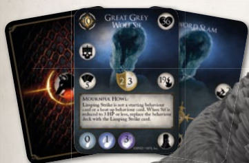
Great Grey Wolf Sif