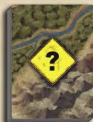
30 WASTELAND- KARTEN (BUSCHLAND / GEBIRGE)