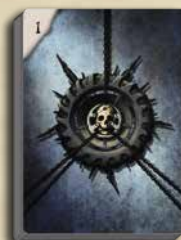
10 SPEZIAL- KARTEN