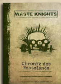
CHRONIK DES WASTELANDS