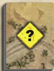
40 WASTELAND- KARTEN (WÜSTE / HIGHWAY)