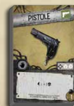
64 AUSRÜS- TUNGSKARTEN