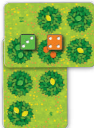
1. Zug: Du platzierst 1 Limetten- und 1 Orangen-Würfel.