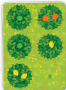
Erste Karte im Zitrushain