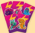
Zombie Welpen (Hinten) Gib deinem Welpen einen Namen!